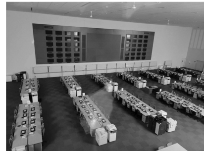
オペレーションルーム