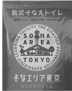
お土産の携帯トイレ